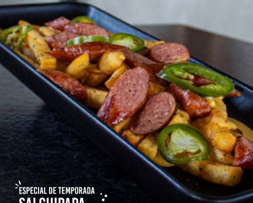
ESPECIAL DE TEMPORADA SALCHIPAPA Q. 79