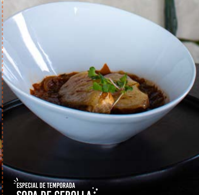
ESPECIAL DE TEMPORADA SOPA DE CEBOLLA Q. 50