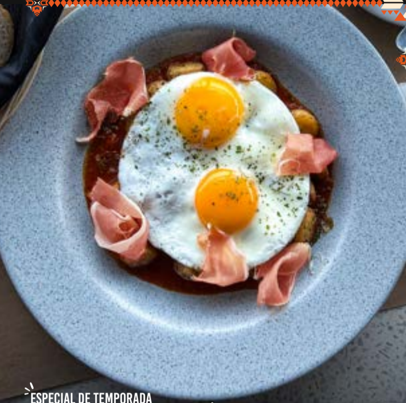
ESPECIAL DE TEMPORADA HUEVOS A LA DIABLA Q. 69