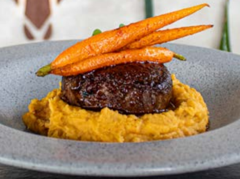
ESPECIAL DE TEMPORADA LOMITO AL ROMERO Q. 175