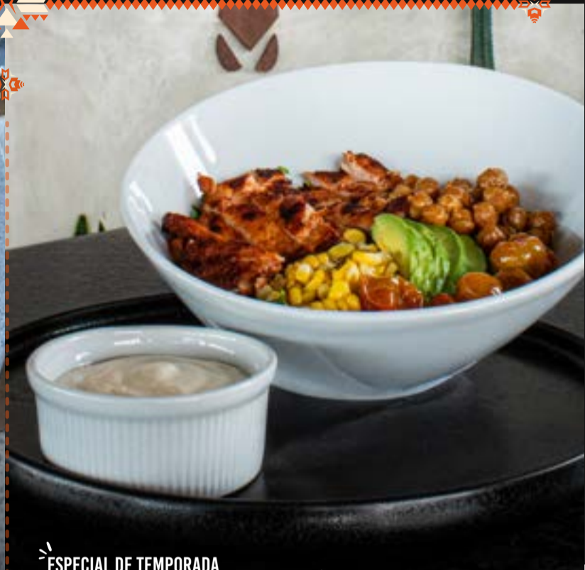
ESPECIAL DE TEMPORADA POKE BOWL DE POLLO Q. 85