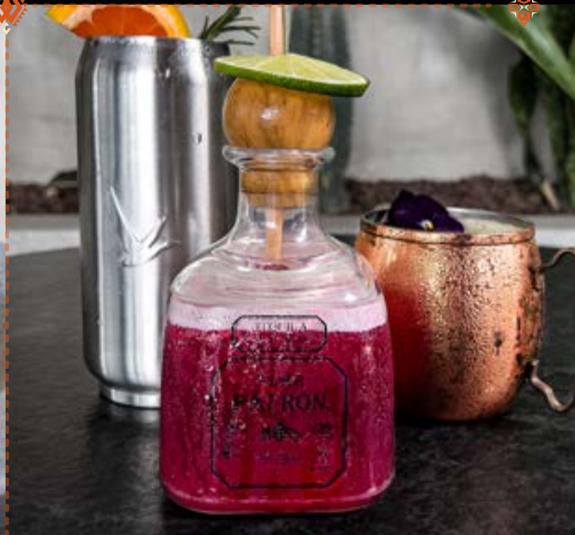
CELEBREMOS A LA PATRONCITA DE LA TRIBU