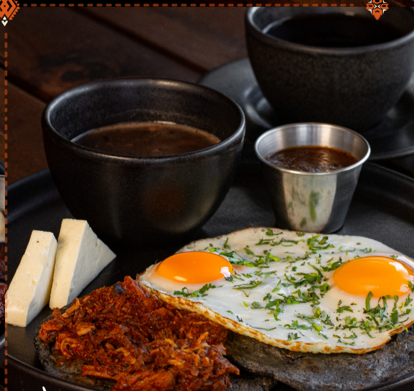
ESPECIAL DE TEMPORADA PARA LA TRIBU CHAPINA Q 75