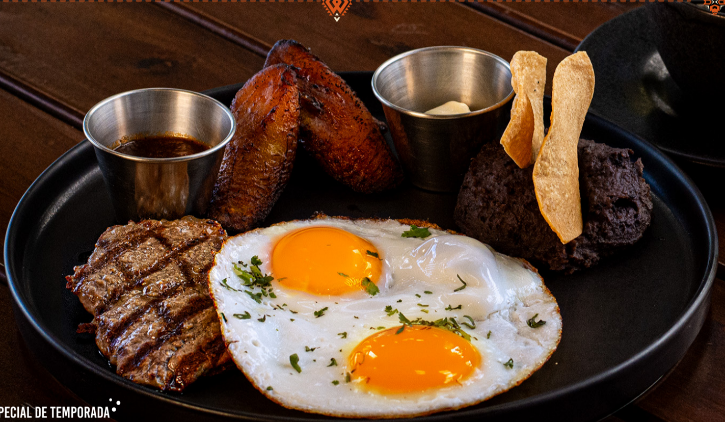
ESPECIAL DE TEMPORADA PARA LA TRIBU VIAJERA Q 89