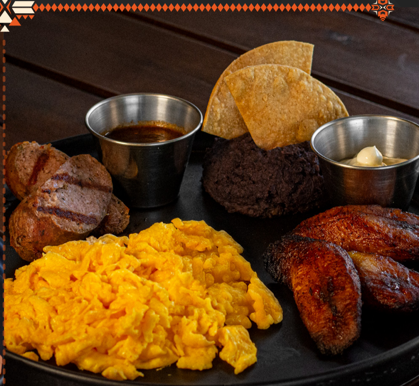
ESPECIAL DE TEMPORADA PARA LA TRIBU ANTIGUEÑA Q 70