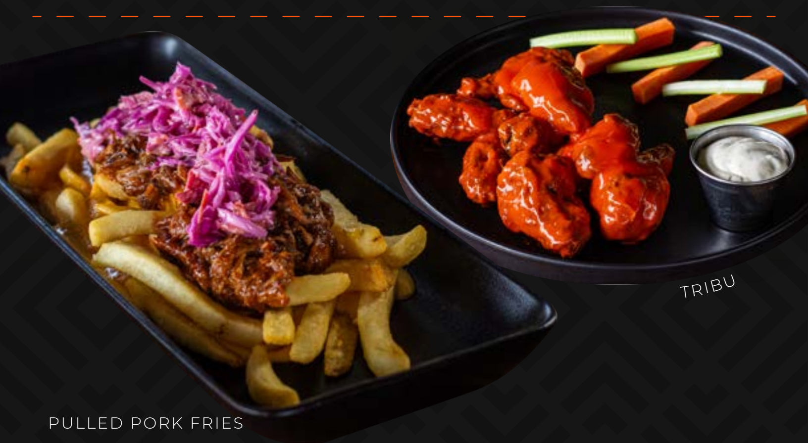
PULLED PORK FRIES

Alitas bañadas en salsa búfalo, acompañadas de aderezo blue cheese o ranch