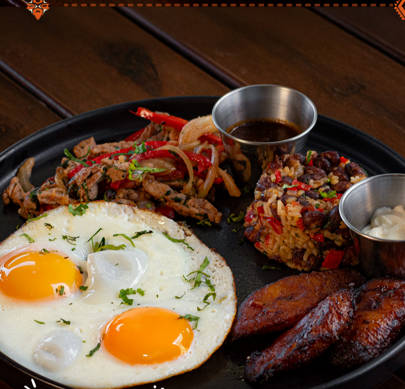
ESPECIAL DE TEMPORADA PARA LA TRIBU GARÍFUNA Q 75