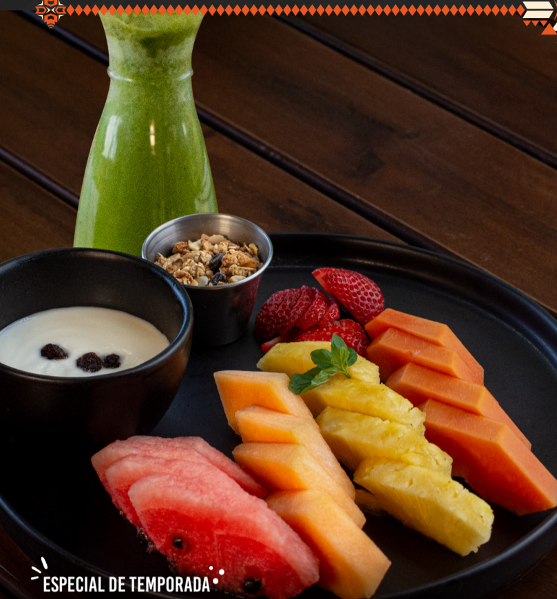
ESPECIAL DE TEMPORADA PARA LA TRIBU SALUDABLE Q 55