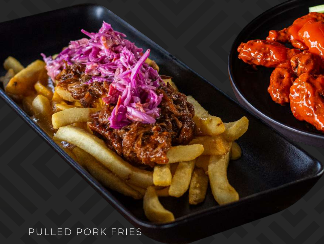
PULLED PORK FRIES

Alitas bañadas en salsa búfalo, acompañadas de aderezo blue cheese o ranch